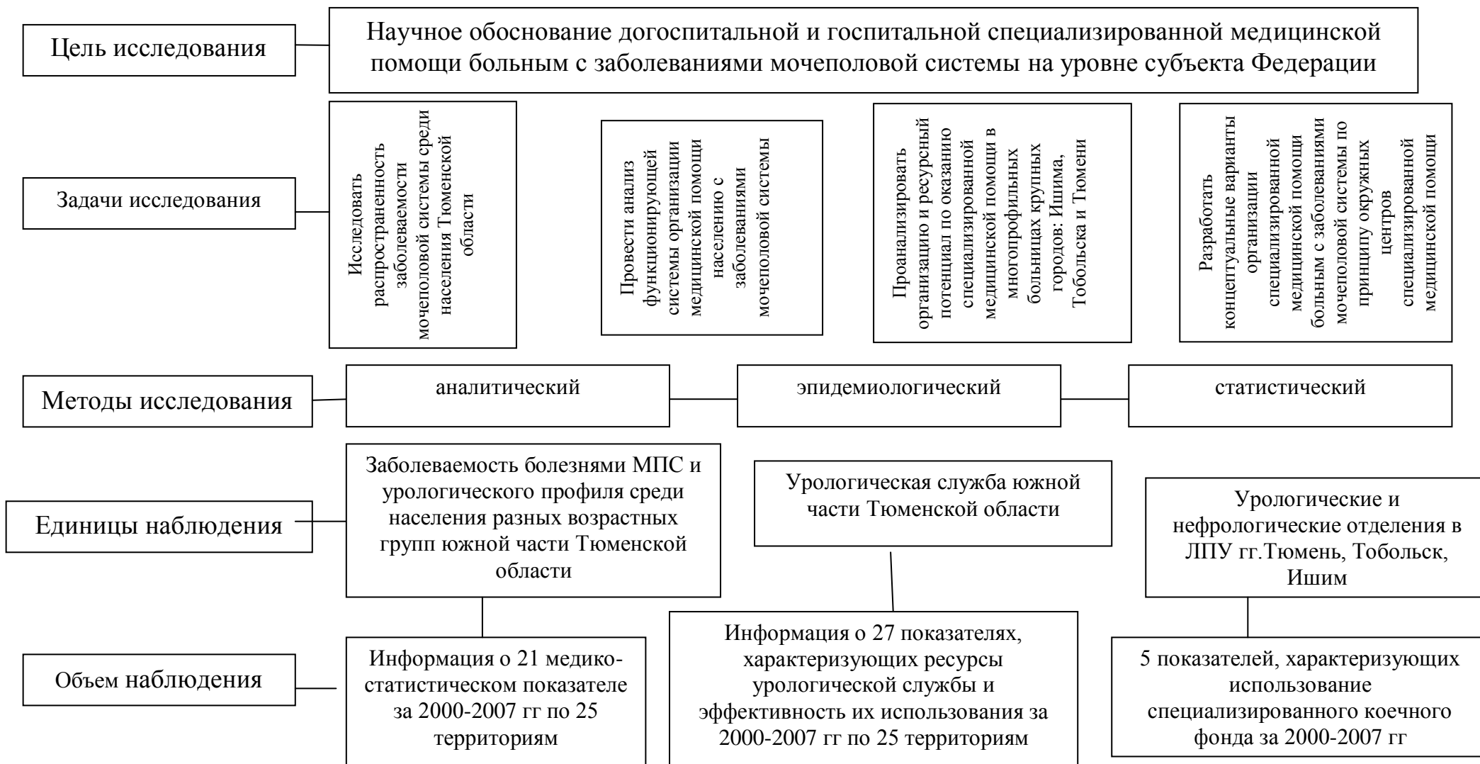
Рисунок 1 - Общая схема исследования